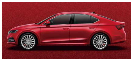
炫彩紅 K1K1 (須加價選購)