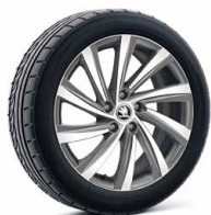
18吋 PERSEUS 鋁圈