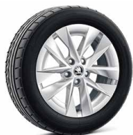
17吋 ROTARE AERO 鋁圈