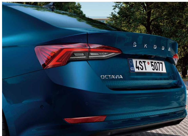
高亮度全 LED 尾燈組 (附動態轉向指示燈展演功能) 為車輛增添動態氣息。尾燈配備了 ŠKODA 家族代表性的裝飾元件。C 形照明運用現代化手法再次升級，水晶元素則代表了捷克水晶玻璃的製造傳統。