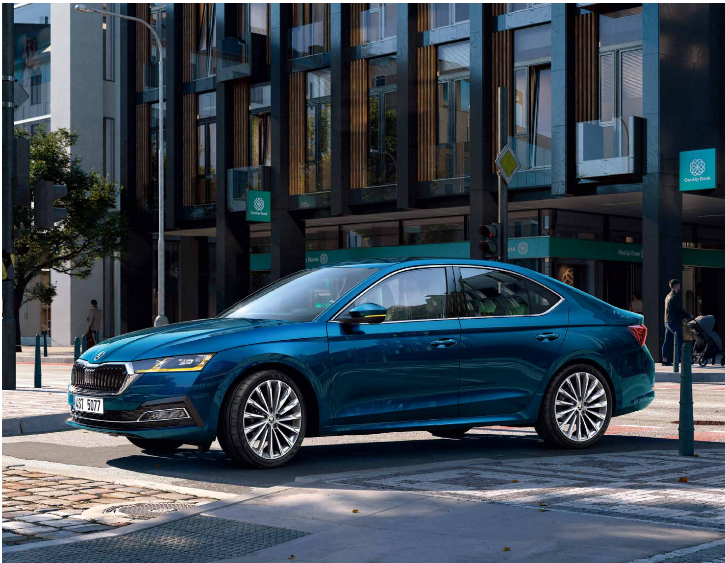
誰說未來需要等待— ŠKODA OCTAVIA 全新上市。