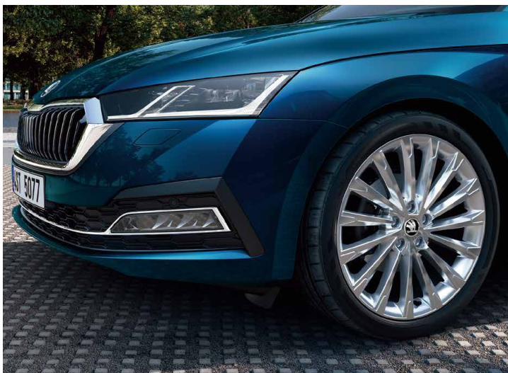
運用擋風玻璃攝影機，OCTAVIA 的 Matrix LED 智慧複眼頭燈組可以偵測前方或對向車輛自動調整遠光燈光束。提供最佳視線，又不會造成其他用路人目眩。